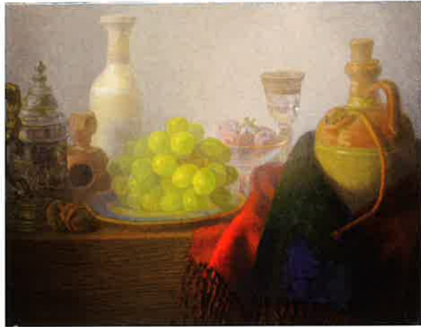
「シャインマスカットとリバーシブルマフラー」 坂田 瑞来