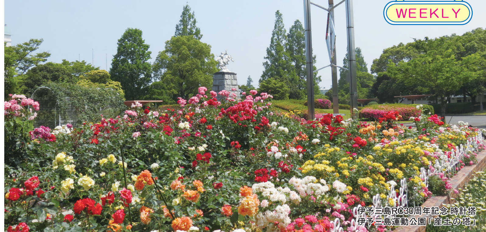
伊予三島RC30周年記念時計塔 伊予三島運動公園「産土の塔」