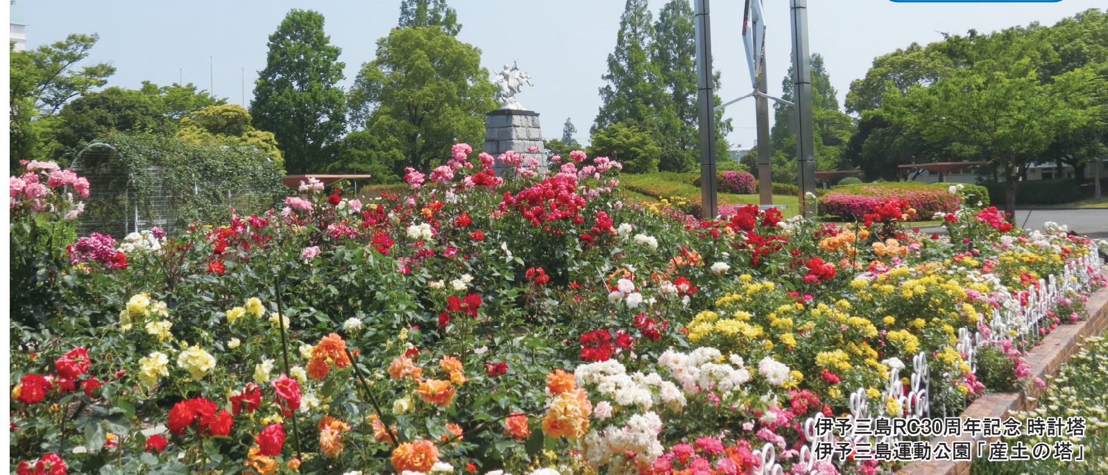
伊予三島RC30周年記念時計塔 伊予三島運動公園「産土の塔」