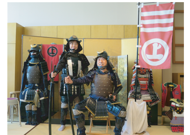
村上水軍の大將と姫になったつもりでパチリ