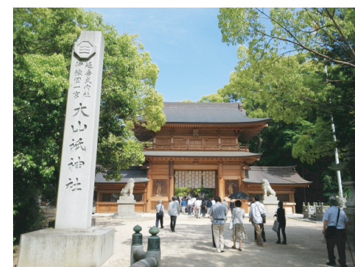
大山祇神社へ清らかな気持ちで参拝