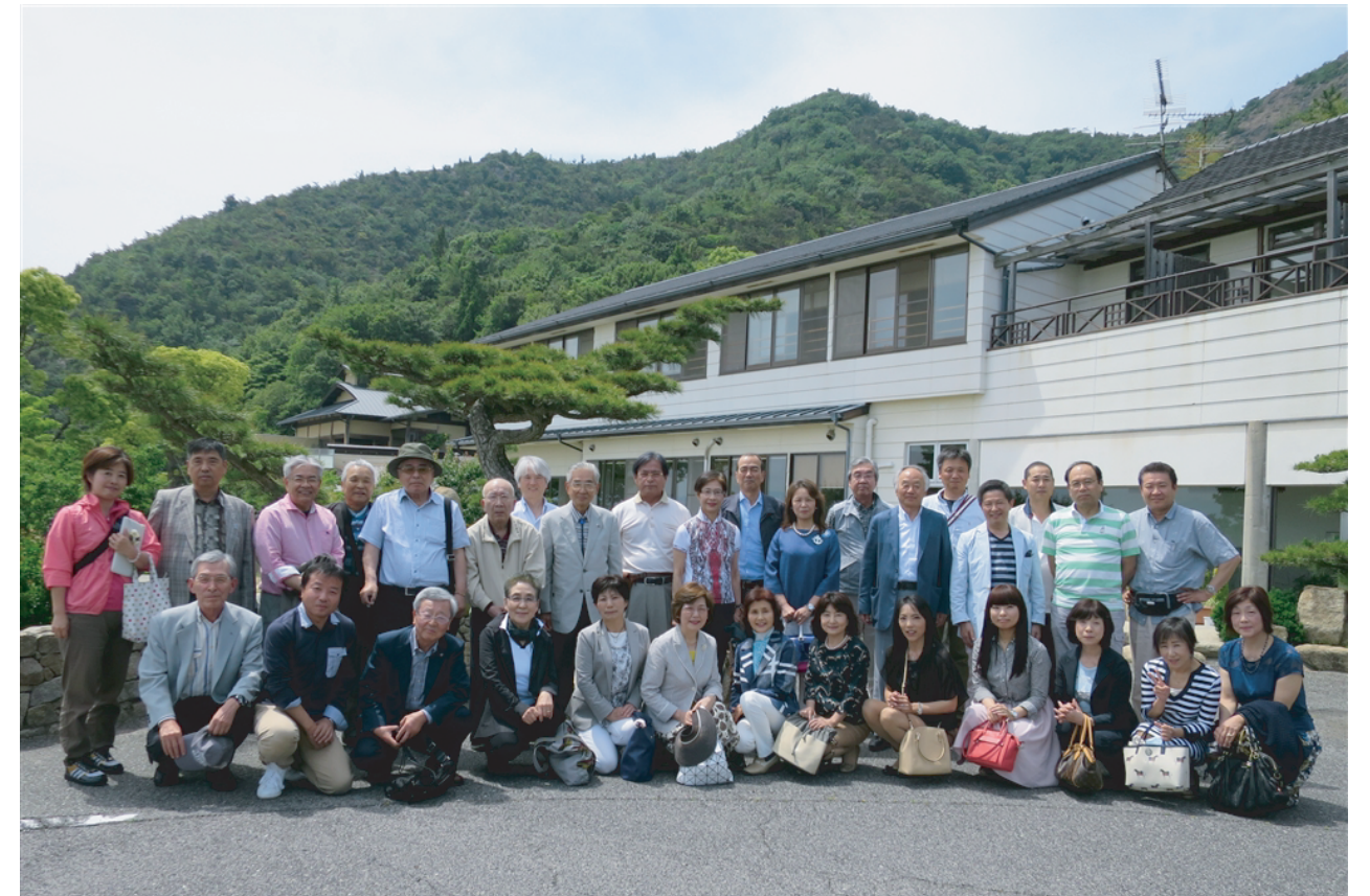
「千年松」での昼食も終わり全員満足した表情でハイパチリ!