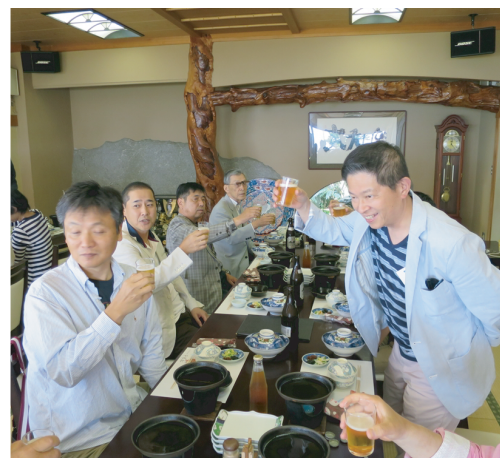
親睦委員長の音頭で食事開始!

下期親睦旅行は上期の結果を踏まえ、近距離で疲れず、美味しいものを食べて親睦を深めるをテーマに企画をしました。で選択したのが、「しまなみ」でした。