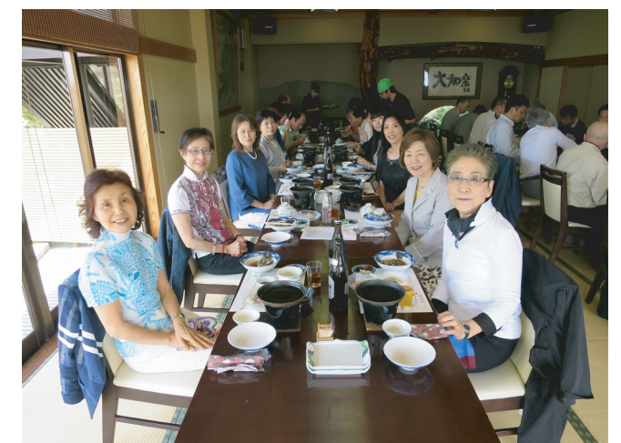
「千年松」の美味しい料理に感動!