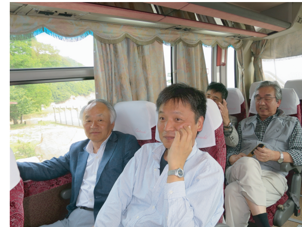
ビールも入って、のんびりバスツアー