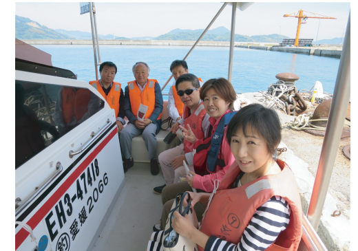
能島水軍の潮流体験は最高!