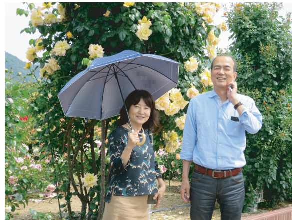
吉海バラ園でも夫婦は一緒!