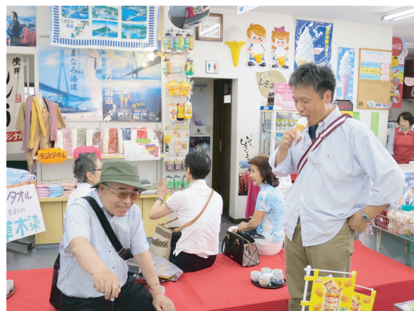
バラの花の観賞よりソフトはうまい!